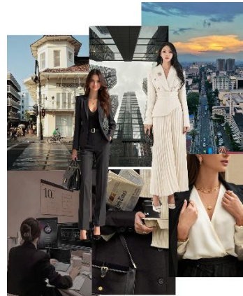
Gambar 3.5 Lifestyle Board Sumber: Pribadi, 2025