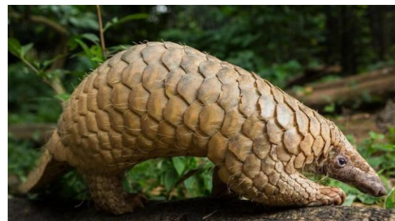
3.1 Trenggiling Jawa

Tidak hanya memiliki keunikan secara visual saja, di Indonesia Trenggiling Jawa memiliki makna simbolis yang mendalam. Ketika menggulung, hewan ini kerap kali disamakan dengan batu karena sisiknya yang kuat, sehingga trenggiling Jawa dimaknai sebagai simbol pertahanan dan perlindungan. Trenggiling Jawa juga diyakini sebagai simbol penolak bala, sehingga motif yang menggunakan trenggiling Jawa dianggap dapat memberikan perlindungan dari marabahaya. Pemanfaatan trenggiling Jawa sebagai visual dalam perhiasan tidak hanya menonjolkan bentuk dan maknanya, tetapi juga mencerminkan kepedulian terhadap satwa yang terancam punah serta menghadirkan motif baru yang jarang dijumpai.