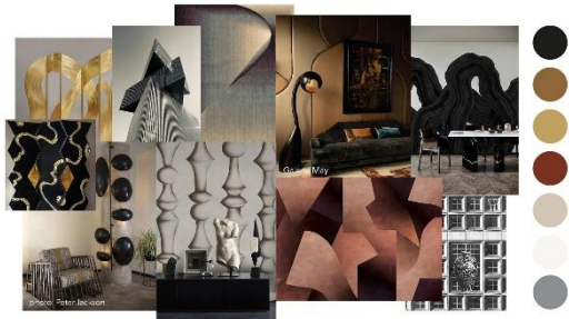
Gambar 3.6 Acuan Estetika Perancangan

Berdasarkan gambar acuan estetika perancangan diatas, perancangan ini mengambil beberapa color palette yang sama dengan gambar tersebut, yaitu warna kuning keemasan, warna coklat, dan warna cream . Bentuk-bentuk organik seperti lonjong dan bulat yang terdapat pada gambar juga menjadi inspirasi bentuk pada perancangan ini.