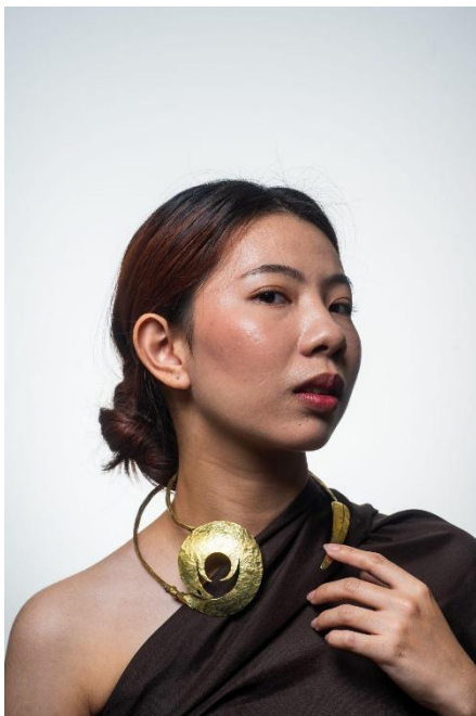
4.13 Foto Produk Kalung