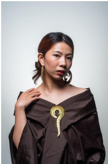
4.8 Foto Produk Bros dan Anting

Hasil perancangan perhiasan yang terinspirasi dari trenggiling Jawa. perancangan dibuat secara bertahap, dimulai dari eksplorasi bentuk, stilasi dan dekonstruksi trenggiling Jawa, kemudian dikembangkan menjadi desain perhiasan yang selaras dengan organic modernism . Eksplorasi dilakukan melalui berbagai teknik seperti laser cut , solder untuk memperdalam karakter visual dari trenggiling Jawa.