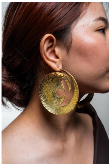
4.9 Foto Produk Anting