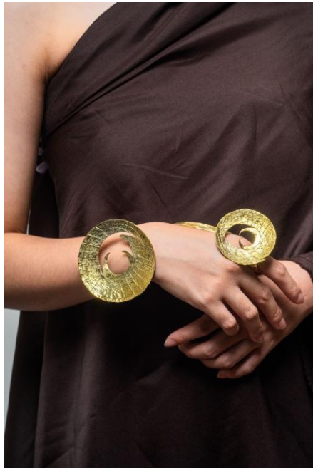
4.12 Foto Produk Cincin dan Gelang