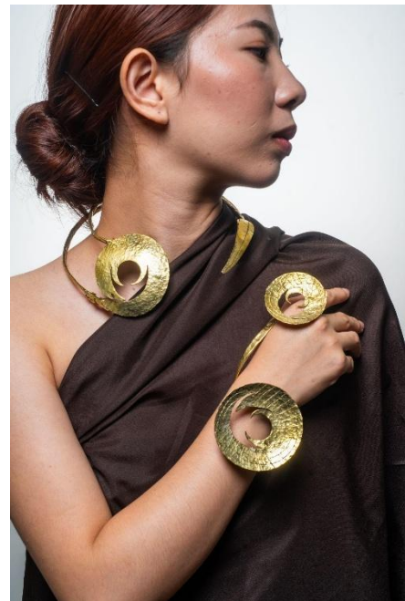
4.11 Foto Produk Kalung, Gelang, dan Cincin