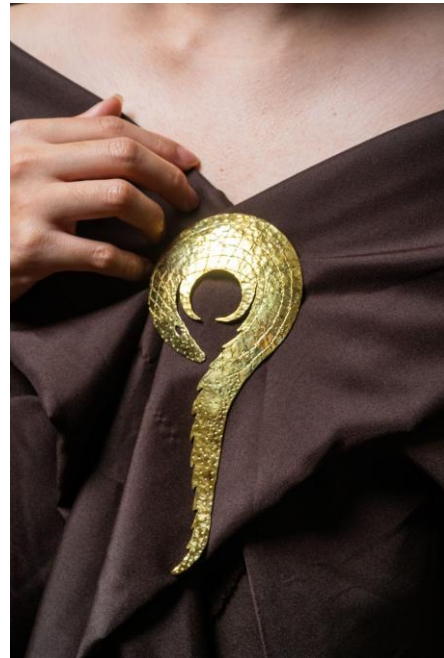
4.10 Foto Produk Bros